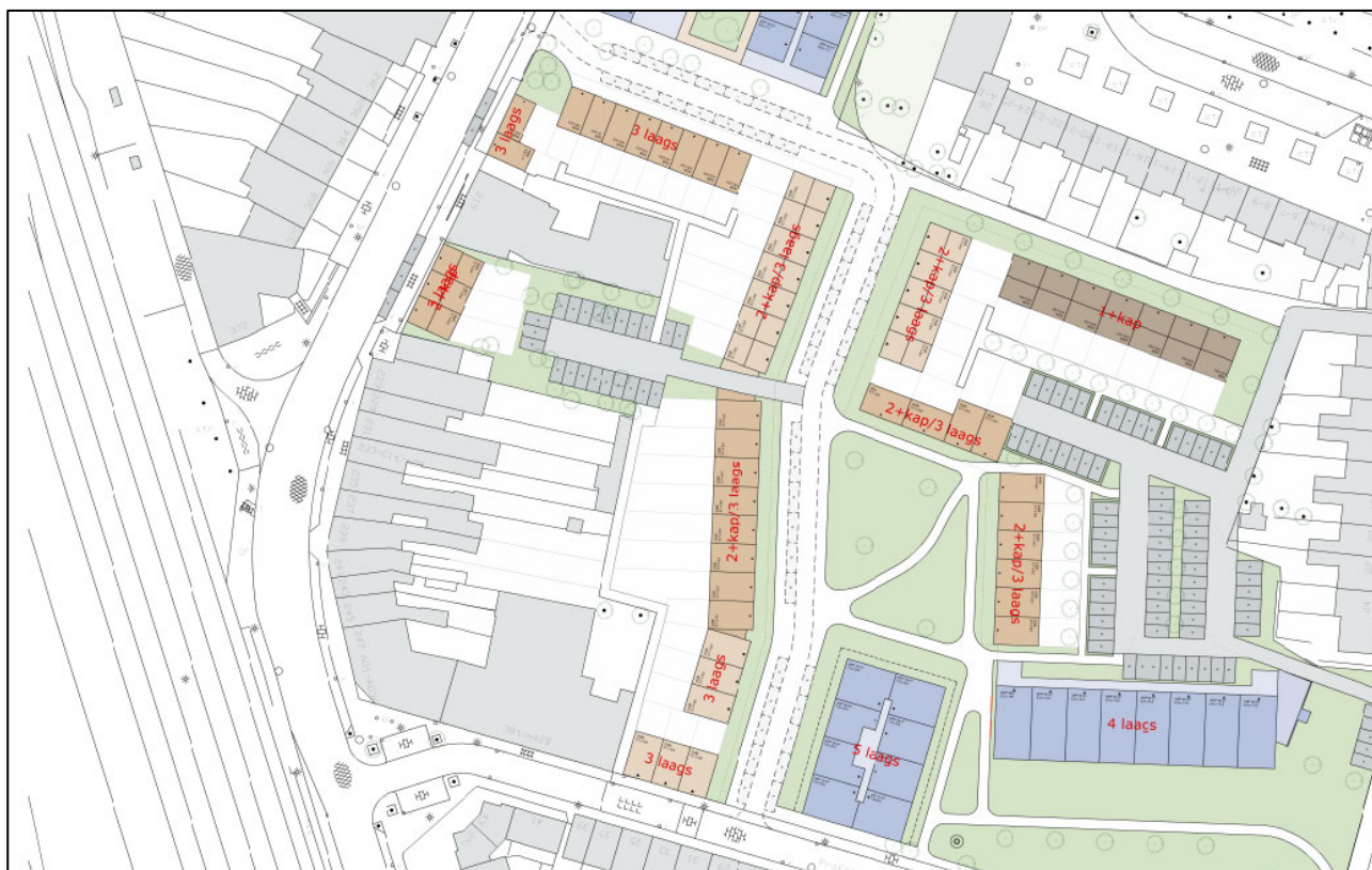
Figuur 1.1: Ligging van het bouwplan (gekleurde vlakken) met links het spoor

Op het terrein van de voormalige porseleinfabriek van de Mosa aan de Meerssenerweg te Maastricht, bestaat het voornemen om diverse soorten woningen te realiseren. Het plangebied ligt tussen de Meerssenerweg aan de westzijde en de Professor Moserstraat aan de zuidzijde. Vlak bij het plangebied, op circa 75 meter afstand, ligt de spoorlijn Maastricht – Sittard. Figuur 1.1 toont de ligging van het bouwplan.